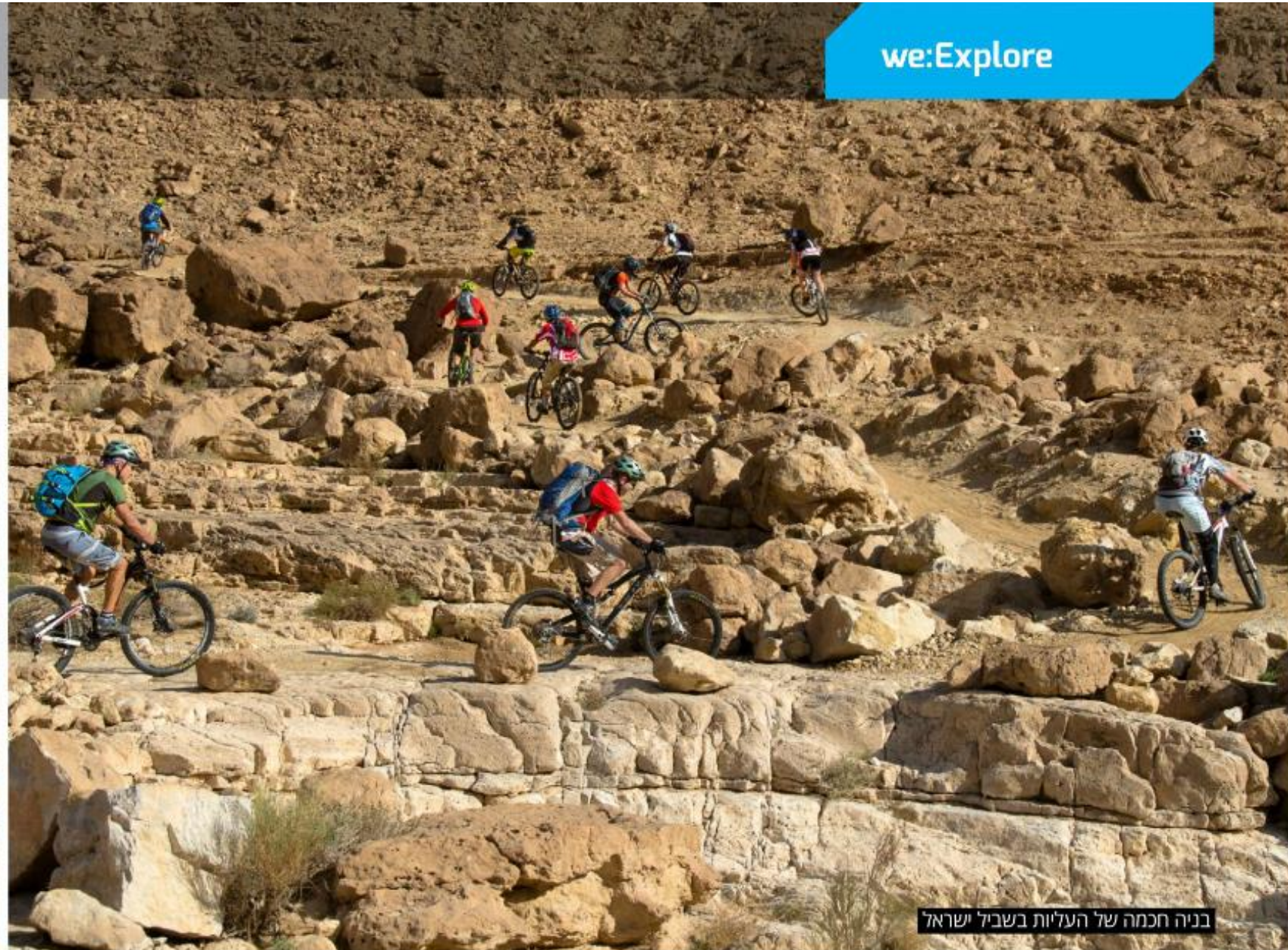
בניה חכמה של העלויות בשביל ישראל

לאחר כ-7 ק"מ על ציר המעיינות נחצה את ערוץ נחל פארן, נעלה על סוללה המשמשת להגנה מפני השיטפונות בנחל ונראה מצד שמאל את החממות של מושב פארן. לפני שורת החממות האחרונה נפנה שמאלה אל בין החממות, ונתרשם מן הפלא הזה של גידול הירקות בלב המדבר. הדרך הופכת בהמשך לכביש, ו-1100 מ' לאחר הפניה אליה נפנה עם הכביש ימינה ונרכב אל תוך מושב פארן 📍