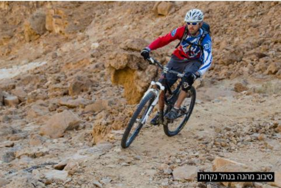
סיבוב מהנה בנחל נקרות