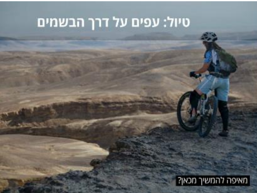
מאיפה להמשיך מכאן?