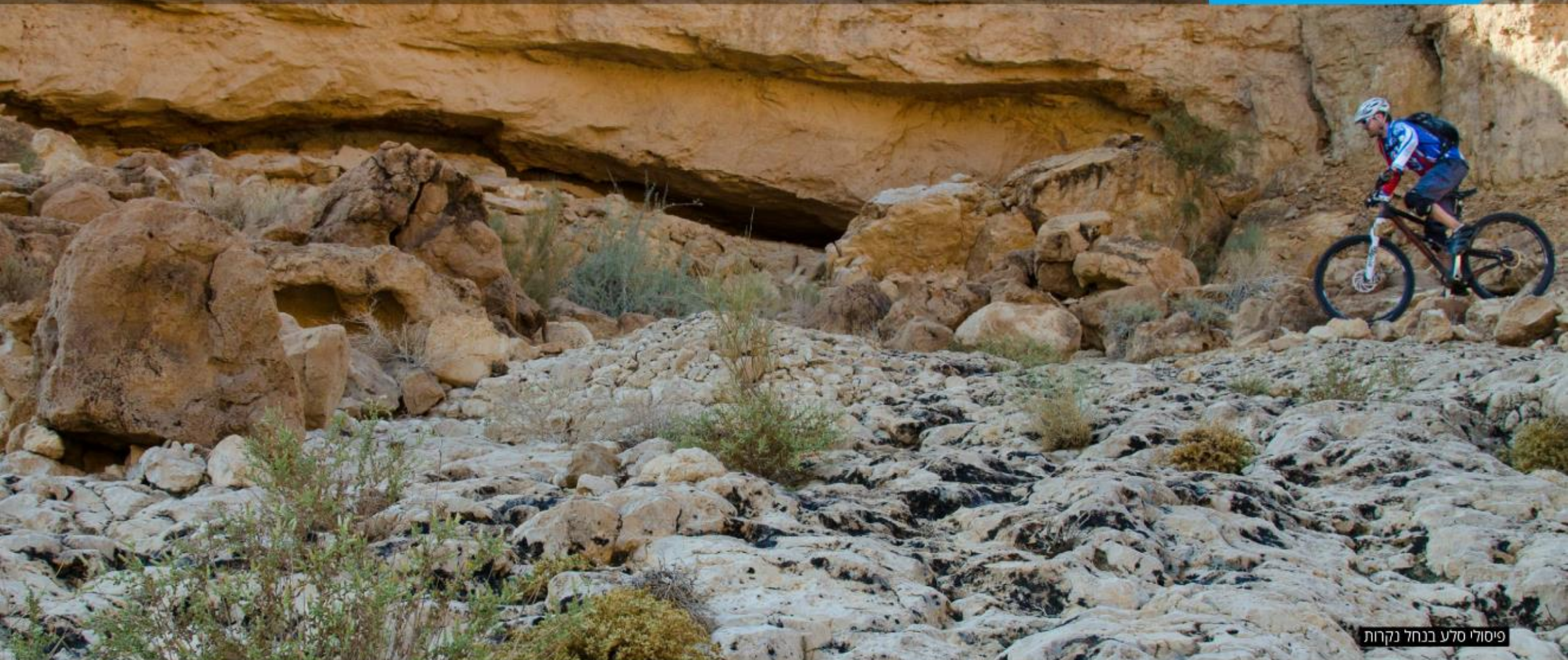
פיסולי סלע בנחל נקרות