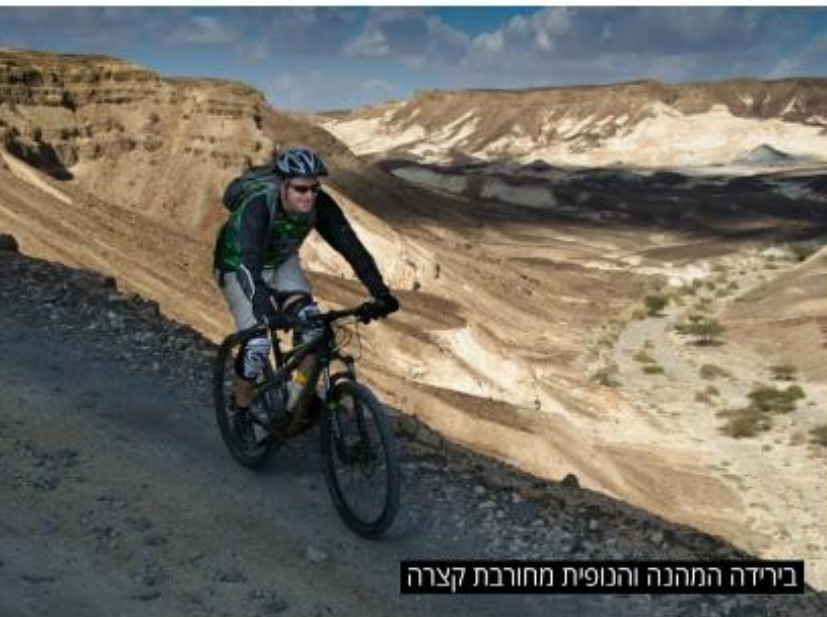
כירידה המהנה והנופית מחורבת קצרה