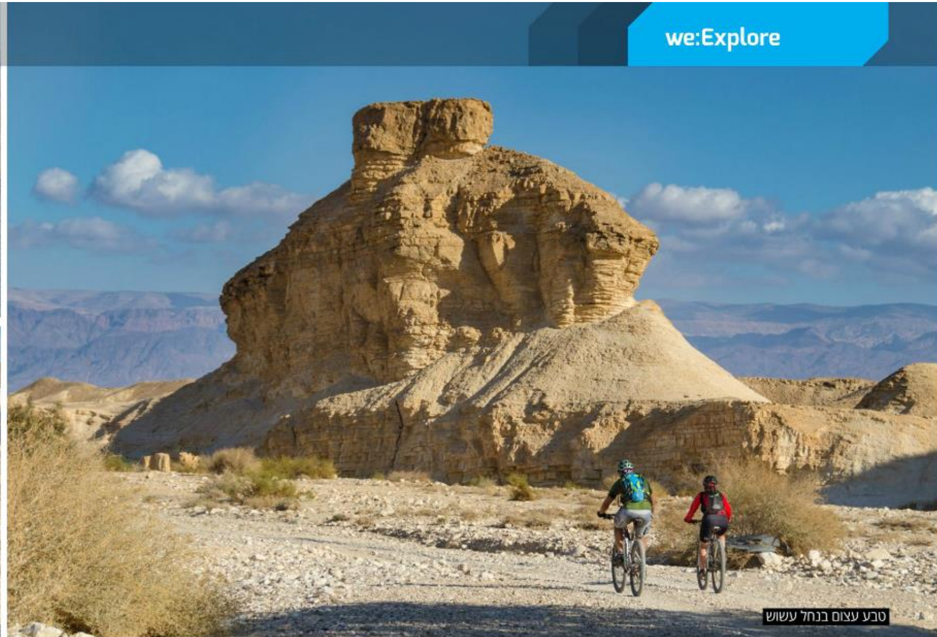
טבע עצום בנחל עשוש